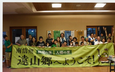
飯田市南信濃町地区

自然が魅力的な辰野町！ その中でも川島区は特に人気の移住先。 地域イベントをはじめ、地元住民の方々が 中心となり移住者支援を行っています。