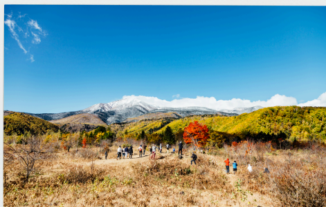
松本市安曇地区大野川区

松本市街地から車で約1時間かかりますが、観光利用が盛んであり、先人たちから継がれてきた自然とともにある暮らしが営まれています。地域内にあるシェアハウスでは地域内外の交流の場として提供しています。