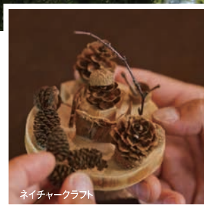
ネイチャークラフト