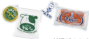
▲全12種のラインナップ